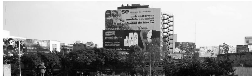
“Franja de Espectaculares”: Edificio de la SSP, DF Autor Gerardo Trujillo, Vista de sur a norte, Año aproximado: 2010

En esta plaza pública, es posible destacar siete edificios, mismos que rodean el total de la Glorieta. Consideramos estos edificios, primeramente, por su altura y dimensiones, además de ser los más representativos independientemente del estado de deterioro, uso o desuso de cada uno de ellos. Algunos más tienen menor importancia visual por su menor altura, como casas o negocios. De estos edificios algunos son más recientes que otros, pero por igual, sirven para la configuración del paisaje que bordea la Glorieta de Insurgentes.