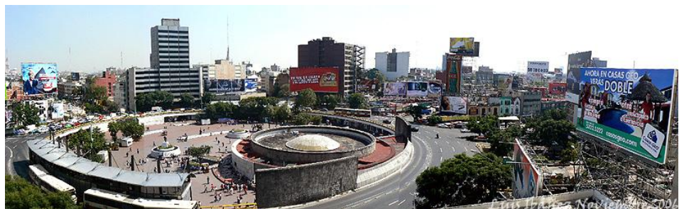
Imagen de la Derecha: Autor desconocido, Vista panorámica, Año: 2007