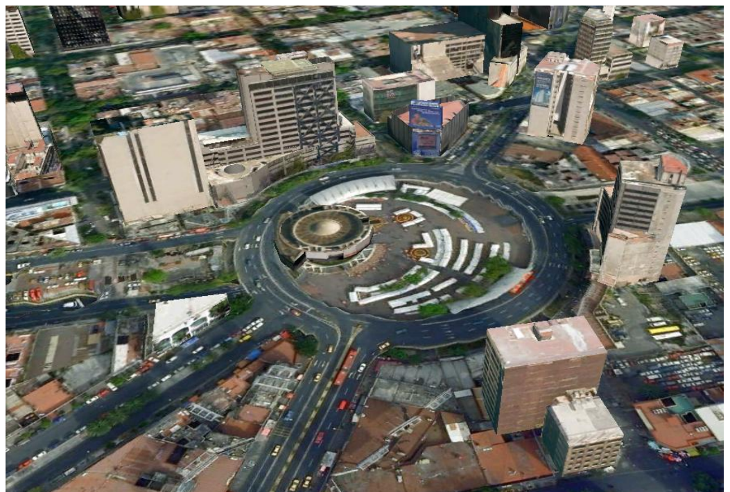
“Render en Perspectiva” Autor: Gerardo Trujillo Fecha de realización: Julio-2011

En esta plaza pública, es posible destacar siete edificios, mismos que rodean el total de la Glorieta. Consideramos estos edificios, primeramente, por su altura y dimensiones, además de ser los más representativos independientemente del estado de deterioro, uso o desuso de cada uno de ellos. Algunos más tienen menor importancia visual por su menor altura, como casas o negocios. De estos edificios algunos son más recientes que otros, pero por igual, sirven para la configuración del paisaje que bordea la Glorieta de Insurgentes.