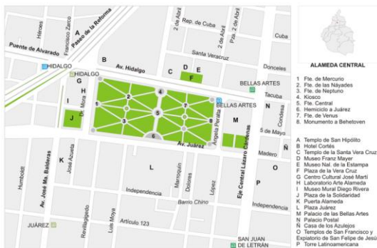
Figura 1: Parque Alameda Central, en: http://es.wikipedia.org/wiki/Alameda_Central

El Parque Alameda Central es delimitado al Norte por Avenida Hidalgo, al Este con la calle de Ángela Peralta donde se encuentra el Palacio de Bellas Artes, al Sur la Avenida Juárez y al Oeste con la calle de Dr. Mora. Tiene una extensión alrededor de 195 por 440 metros, es decir 8.58 hectáreas en total. En su proximidad se encuentran dos llamados "Pocketparks" ("Parques de bolsillo"); la Plaza de la Soledad, en la cual hoy en día hay montado un carrusel y la Plaza de la Vera Cruz, que sirve como explanada tanto al Templo de la Santa Vera Cruz así como al Museo Franz Mayer y al Museo Nacional de la Estampa ( Figura 1 ).