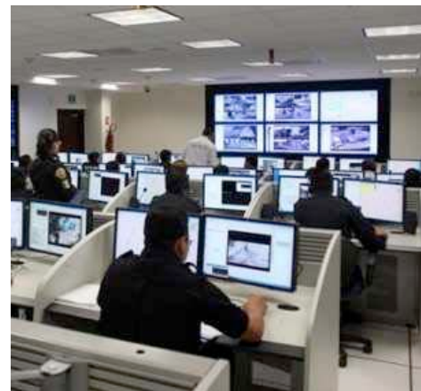
Salón de sistema de video vigilancia del Gobierno del D.F.