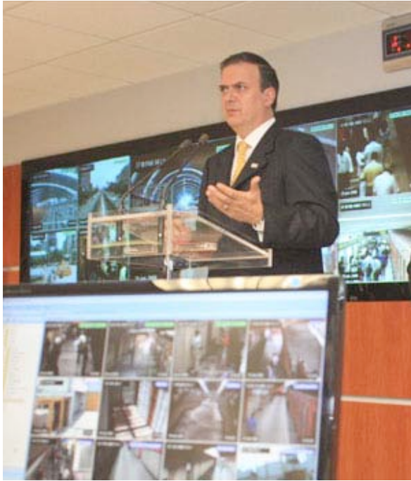
Jefe de gobierno del D.F. En la presentación del nuevo sistema de vigilancia