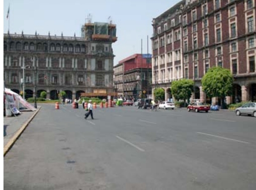
Seguridad Vial, cierre de carriles por motivo de una manifestación