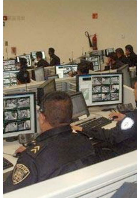
Salón de sistema de video vigilancia del Gobierno del D.F.