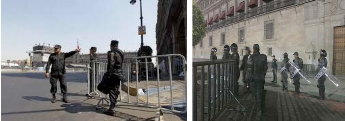
Vallas de seguridad y personal uniformado de vigilancia

Rescate, urgencias Médicas, Protección Civil (marcando rutas de evacuación), Bomberos y la Procuraduría General de Justicia del Distrito Federal etc. etc.,