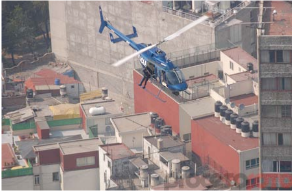
Helicóptero de vigilancia en las calles del centro histórico