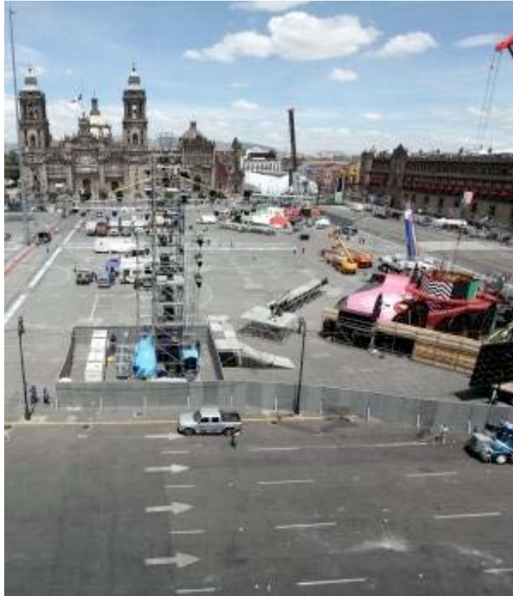
Preparativos para festejos dentro de la explanada de la Plaza de la Constitución

En esta plaza confluyen diversos actores sociales lo cual hace de este espacio uno apto para manifestaciones de diversos eventos culturales, políticos y artísticos, en donde la seguridad es un tema fundamental adoptando medidas de diversas magnitudes.