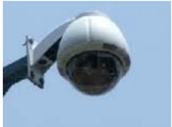
Colocación de Cámaras de vigilancia

Con el incremento de las tecnologías incorporadas a la seguridad se incorporaron torres con cámaras de vigilancia a la seguridad, se direccionaron las cámaras a puntos evaluados como los mas vulnerables de la plaza y los alrededores, se instalaron 82 cámaras de vigilancia en el primer Cuadro y otras cuadras mas según el plan de rescate del Centro Histórico.